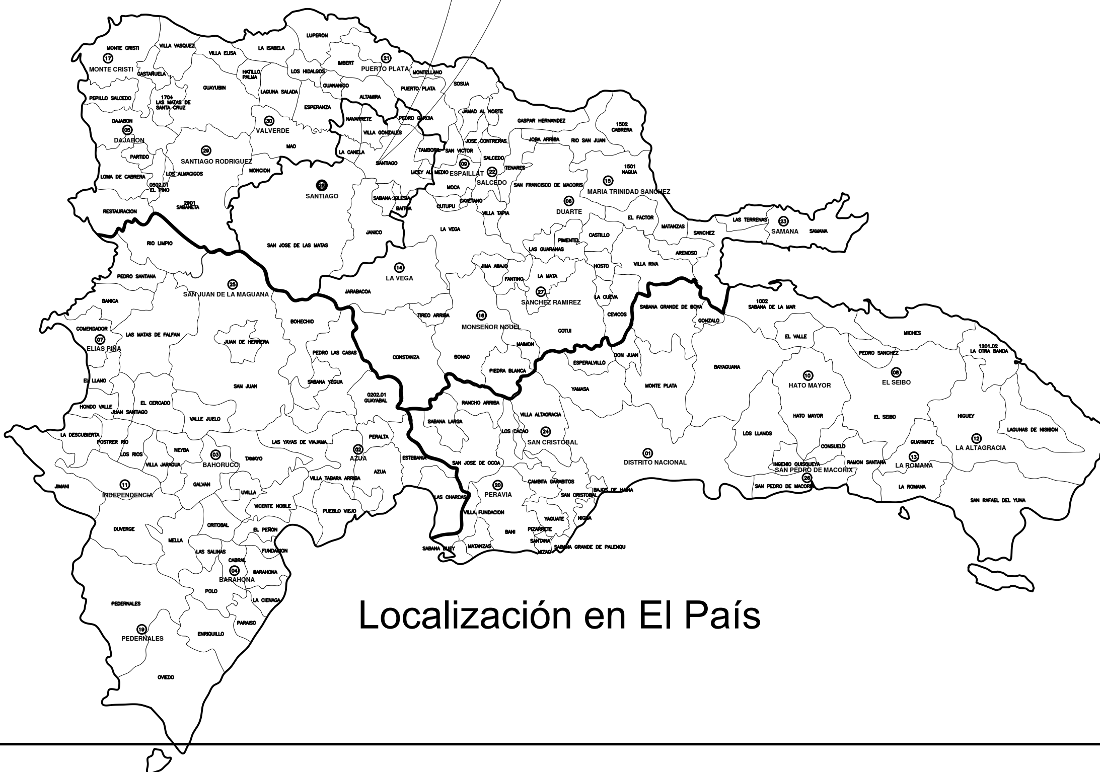
Localización en El País